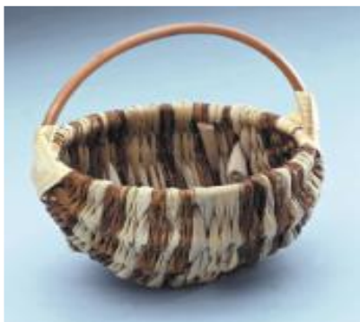
Petit panier à pommes